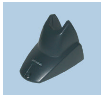
STD Heron™, Ständer für den Freihandbetrieb, optional erhältlich mit Metallplatte